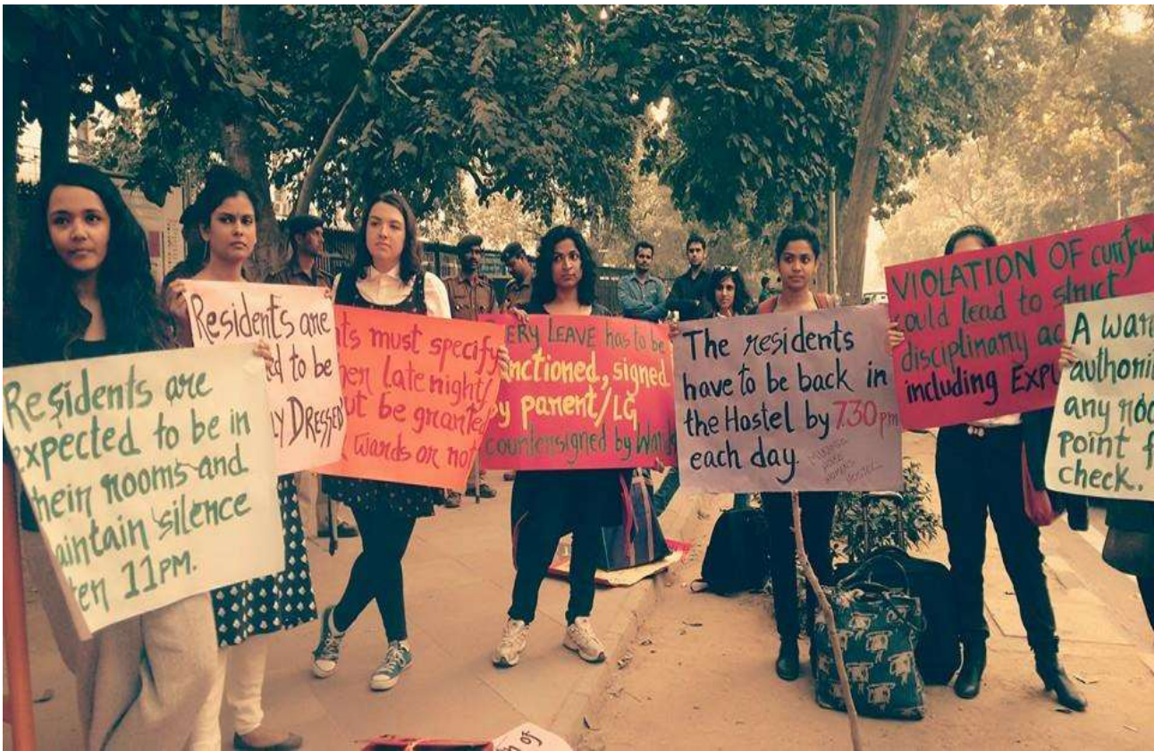
عکسی از اعتراضات پینجرا تاد

این چیزی بود که در پایتخت هند، دهلی، اتفاق افتاد؛ با این حال، شهرهای دیگر هند و مخصوصاً مرکز شهرها نیز شاهد انواع اعتراضات بوده‌اند و هستند. معترضان، فقط زمانی که مسئولان شهر خودشان اعتراضات را نادیده بگیرند، به دهلی و دولت مرکزی 44 روی می‌آورند. شهرهای دیگر از مرکز پیروی کرده‌اند و اعتراضات را به فضاهایی مشخص محدود کرده‌اند. وقتی اعتراضات به مکان‌های خاصی رانده شوند، چه اتفاقی می‌افتد؟ آیا اعتراضات موفق خواهند بود؟ آیا صدای مردم شنیده خواهد شد؟ آیا اقدام فوری به عمل خواهد آمد؟ چه پیامدهایی در انتظار معترضان است؟ پاسخ معترضان به این پیامدها چیست؟