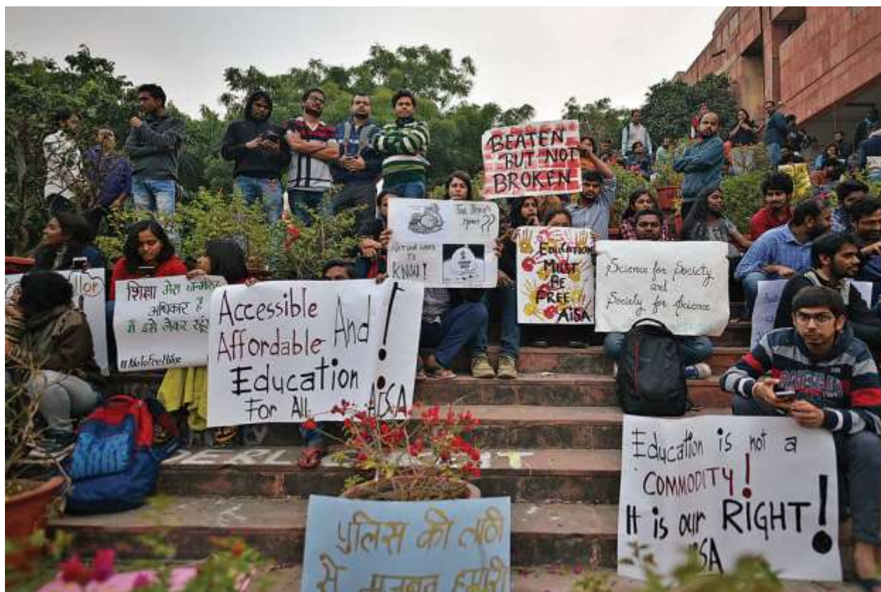
اعتراض دانشجویان به افزایش شهریه‌ها، روبه‌روی ساختمان اداری دانشگاه جواهر لعل نهرو، ۲۲ نوامبر ۲۰۱۹

شنیده شویم. اعضای انجمن دانشجویی جواهر لعل نهرو جنبشی اشغال‌گرانه دور تا دور بلوک اداری 124 ترتیب دادند، زیرا به درخواستشان مبنی بر برگزاری جلسه با مدیریت دانشگاه دربارهٔ قوانین پذیرش دانشجویان ورودی جواب ندادند. این یعنی دانشجو کاملاً حق دارد فضایی اشغال‌شده به‌دست اداره و مدیریت را پس بگیرد. در زمانی دیگر، انجمن دانشجویی جواهر لعل نهرو دفتر کمیسیون کمک‌هزینه‌های دانشگاه 125 را به‌مدت پانزده روز اشغال کرد تا مطالبات خود را به گوش افراد مربوط برساند.