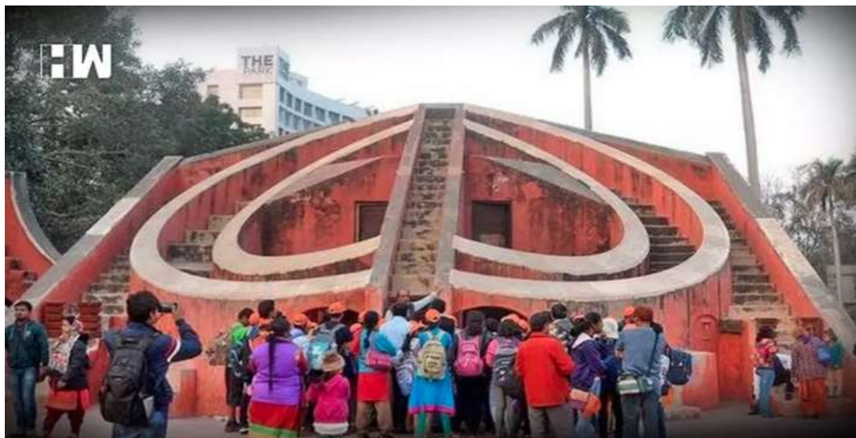
«حداکثر یک روز، ۵۰۰۰ معترض»؛ پلیس دهلی احتمالاً توصیه‌هایی برای اعتراض در جنتر منتر ارائه خواهد داد.

اینکه مکان تظاهرات از راجپات به جنتر منتر منتقل شد، جای شک باقی نگذاشت که تعیین فضاهایی خاص برای اعتراضات حاصل ماهیت غیردموکراتیک دولت است. جنتر منتر از سال ۱۹۹۳، یعنی دو سال پس از اینکه هند آزادسازی را انتخاب کرد، مکان مجاز اعتراضات بوده است. جنتر منتر در مقایسه با راجپات علی‌رغم حفظ فاصله لازم، به مجلس 41 نزدیک‌تر بود و آن قدری بزرگ بود که جمعیت‌های زیاد را در خود جای دهد. همچنین ورودی و خروجی اصلی باریکش مدیریت و کنترل جمعیت را برای پلیس آسان می‌کرد. اعتراضات فقط در محل معین مجاز است و دلیلی هم که برایش ذکر می‌کنند بر هم نخوردن روند طبیعی زندگی مردم و دولت است؛ در حالی که هدف اصلی اعتراضات برهم‌زدن امر اجتماعی-فرهنگی-سیاسی به اصطلاح «مقرر یا عادی» و تغییر آن است. مشخص کردن مکان مجاز برای اعتراض نمی‌گذارد اعتراضات نظم عادی را بر هم بزنند و این ویژگی مهم را از اعتراض سلب می‌کند؛ همچنین، فضاهای معین ذات غیردموکراتیک دولت را آشکار می‌کنند که اجازه تصرف فضا را به مردم نمی‌دهد. تصرف 42 فضا را باید تصرف قدرت و اختیار دولتمردان و در نهایت، خود دولت دانست. دولت هند، به بهانه تقویت دموکراسی، فضایی را برای بروز مخالفت مردم فراهم کرد، اما تعیین این فضاها هرگز به تقویت دموکراسی منجر نشد؛ برعکس، آن را تضعیف کرد. بعضی معتقدند که ممکن است قصد دولت همین باشد؛ در نتیجه، «سیاست فضا» 43 به جنبه مهمی از سیاست هند تبدیل شد.