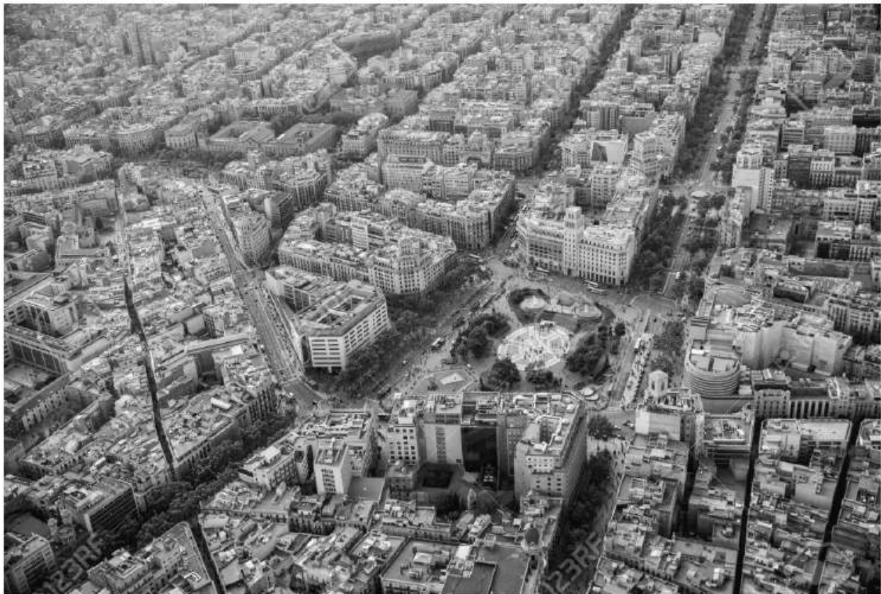
عکس ۷: میدان کاتالونیا از نمای بالا

دوم اینکه این پرسش مطرح می‌شود که فضای شهری چطور طراحی می‌شود و چرا برپایی این اردوها در آن فضا این قدر خوب جواب داد؟ (عکس ۷)