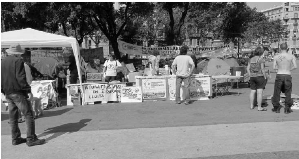
عکس ۶: باجه‌های اطلاعات برای تازه‌واردان برپا شده‌است.