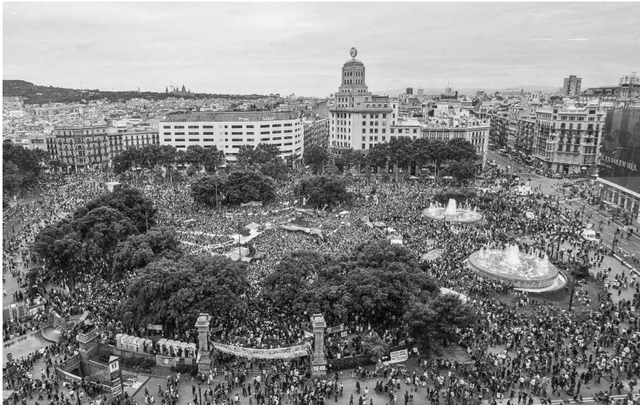
عکس ۱. جنبش برآشفندگان (ایندیگنادوس) در پلازا کاتالونیا، بارسلونا

بی‌شک بارسلونا از آن شهرهای دوستدار اعتراض است و بالیدن در این شهر موجب شده، اعتراضات زیادی را در آن تجربه کنم آن‌هم دست‌اول. بعضی از این اعتراضات از بقیه موفق‌تر بودند. من به این پرسش علاقه‌مندم که چرا اعتراضات شکل می‌گیرند و چه چیزی موجب می‌شود به‌خوبی عمل کنند. اعتراض شهری مستقیماً به طراحی شهری مربوط می‌شود؛ همان‌طور که در بارسلونا می‌بینیم اعتراض اجتماعی خیلی رایج است و شرکت‌کنندگان آموخته‌اند که چطور از عناصر کلیدی طراحی فضایی به نفع خود استفاده کنند. هدف این نوشتار بررسی این پرسش است که چطور طراحی شهری در امکان یا امتناع اعتراض در حوزه عمومی ایفای نقش می‌کند؛ به‌عبارت‌دیگر، چطور طراحی شهری موجب می‌شود یک اعتراض توفیق یابد و تأثیر مثبتی داشته باشد یا در یک زمینه فیزیکی فضایی شکست بخورد.